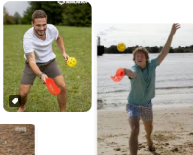
(D) Lacrosse Fangkörbe