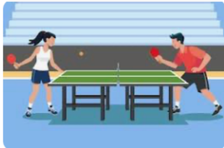
(B) Tischtennisschläger und Ball